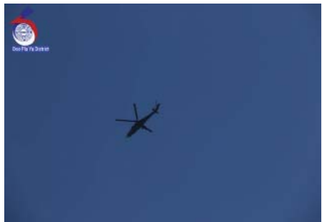
သးမိၤစီရိၤအသး ဟဲခးလီၤတၢ်လၢ ကဘီယုၤသဲ သးက့ (၆) ဟံာ်ကစီၤ