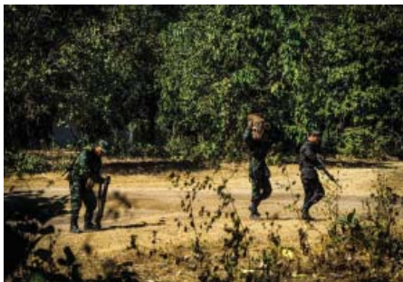
သးက့ (၆) သးဖိ