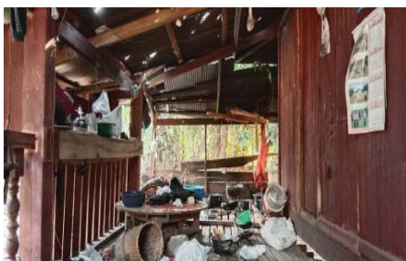
သးမိၤစီရိၤအသးကဘီယုၤတဖၣ် ခးလီၤတၢ်အယံ ဘၣ်ဟးဂီၤဝဲ ကမုာ်အဟံာ် ဖဲဒုပျဉ်ယာ်ကီာ်ရၢန့ၣ် ဟံာ်ကစီၤ