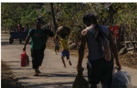
ဒုပျဉ်ယာ်ကီာ်ရၢန့ၣ် ကမုာ်တဖၣ် ဘၣ်ဃုာ်ဖွဲဟးဖျးတၢ်ဂီၤ