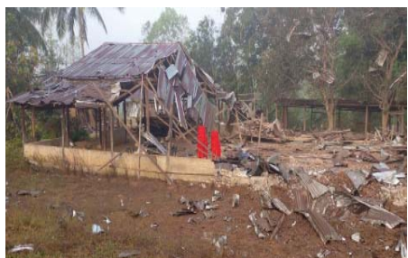
သးမိၤစီရိၤအသး ဟဲခးလီၤတၢ်လၢ ကဘီယုၤသဲ သးက့ (၅) ဟံာ်ကစီၤ