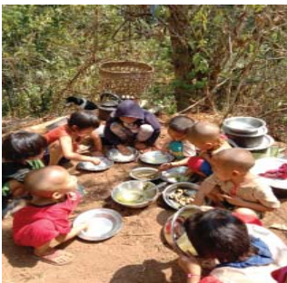
မုာ်တြီာ်ကီာ်ရၢန့ၣ် ကမုာ်တဖၣ် ဃုာ်ဖွဲဟးဖျးတၢ်ဂီၤ